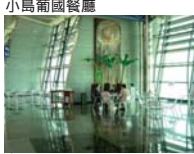
Cafe on 4

Cafe on 4 (カフェ・オン4) 劇場の隣にあるカジュアルな雰囲気のレストラン・カフェ。フレンチ・ウィンドウから眺めるダイナミックなハーバービューが圧巻