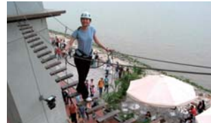
アイアンウォーク